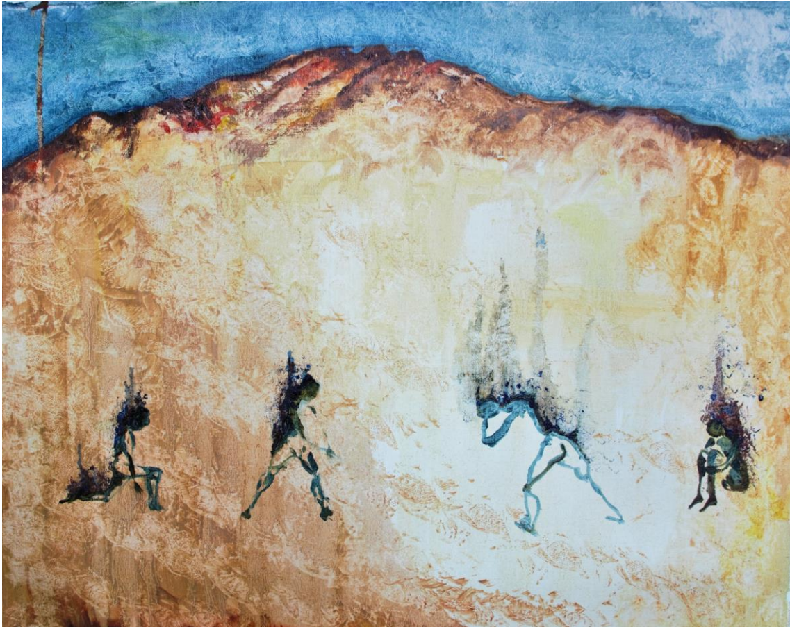
fede capdet de la sèrie com un ocell a la Via Làctia # 9 oli sobre tela 63 x 50 cm.