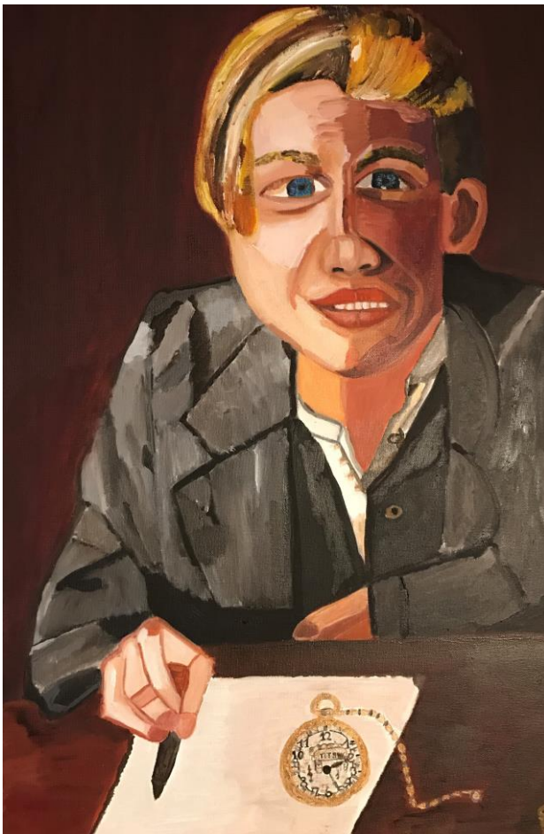
HelEnArt TITANIC Leonardo di Caprio Oli sobre tela 61 x 38 cm.