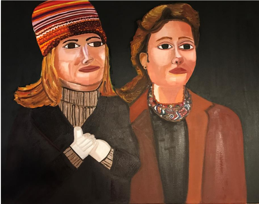
HelEnArt QUEDA'T AL MEU COSTAT Julia Roberts Susan Sarandon Oli sobre tela 81 x 65 cm.