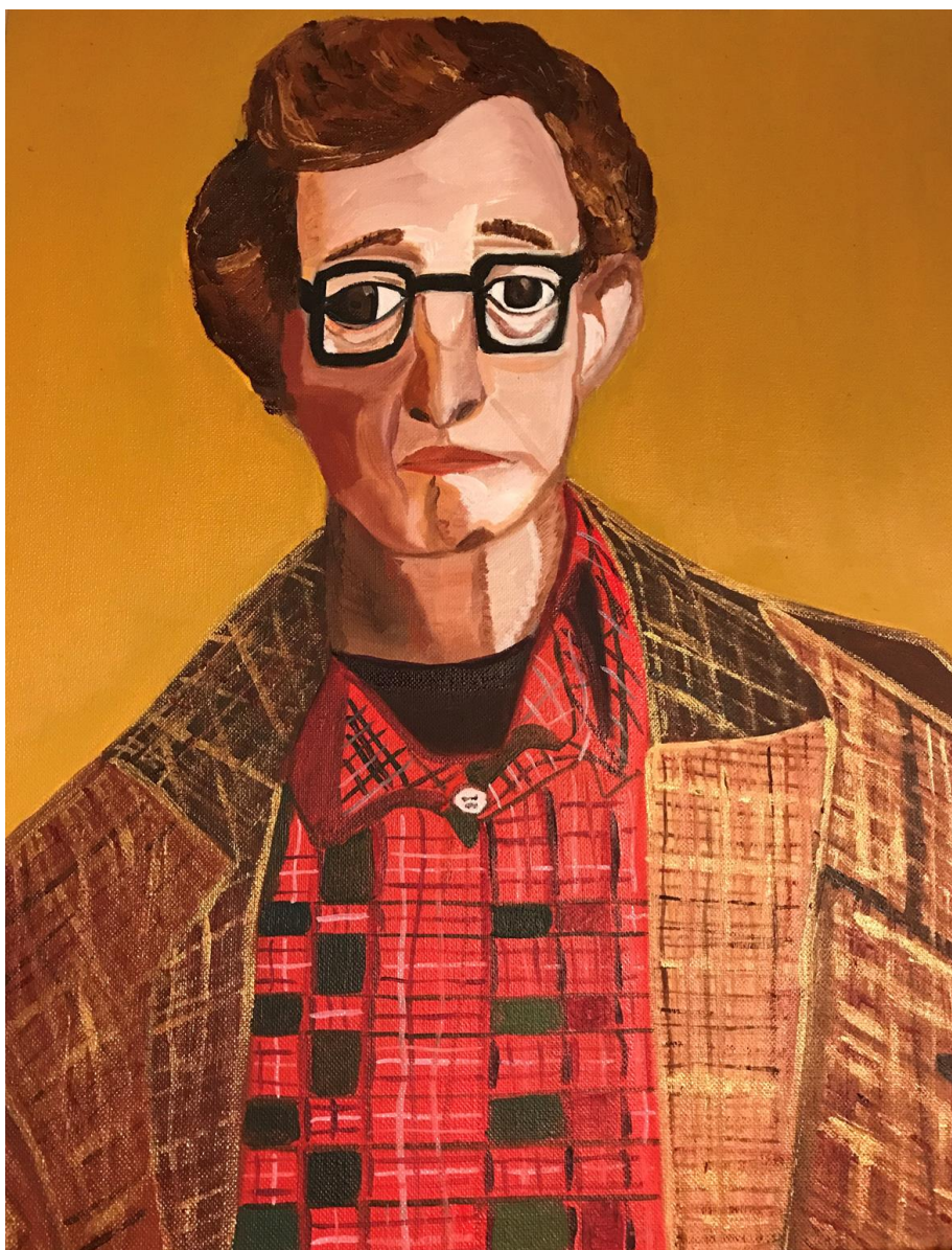
HelEnArt WOODY ALLEN Oli sobre tela 46 x 38 cm.