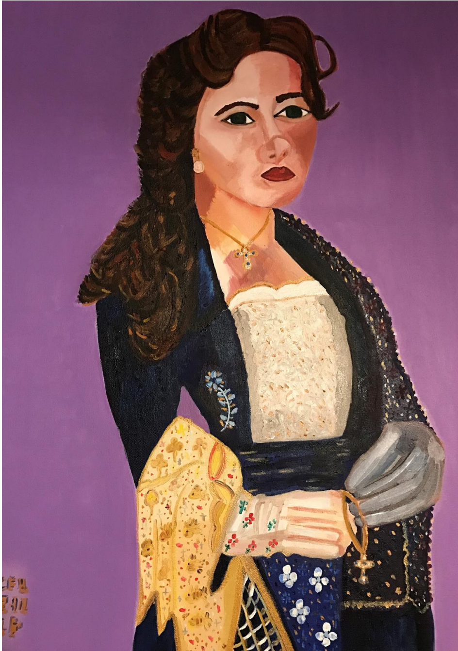
HelEnArt TITÀNIC Kate Winslet Oli sobre tela 73 x 54 cm.