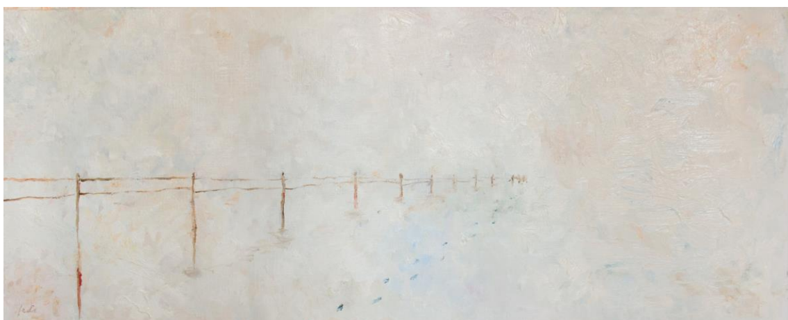
fede capdet de la sèrie com un ocell a la Via Làctia # 1 oli sobre tela 69 x 27 cm.