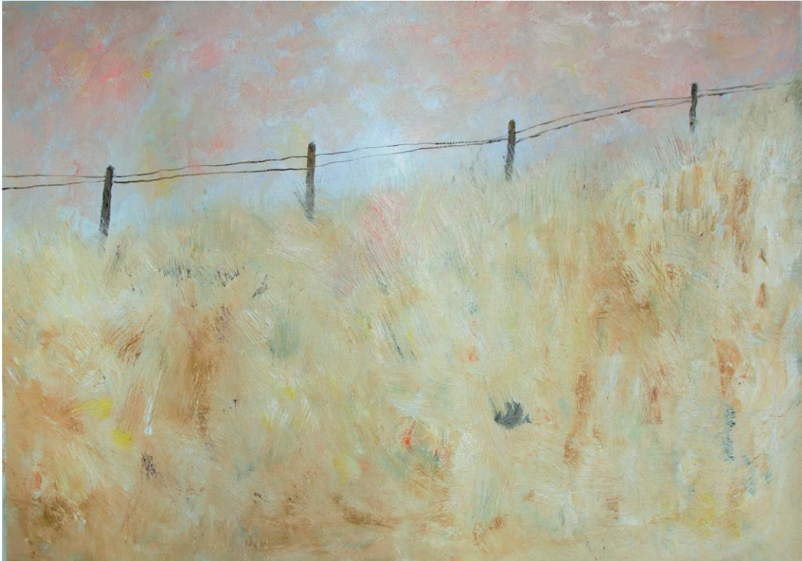
fede capdet de la sèrie com un ocell a la Via Làctia # 5 oli sobre tela 70 x 50 cm.