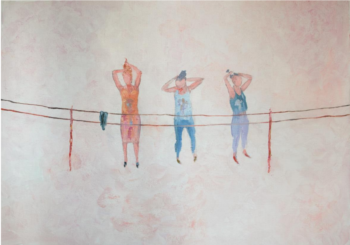
fede capdet de la sèrie com un ocell a la Via Làctia # 3 oli sobre tela 70 x 50 cm.