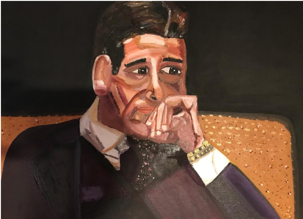
HelEnArt EL PADRINO Al Pacino Oli sobre tela 38 x 61 cm.