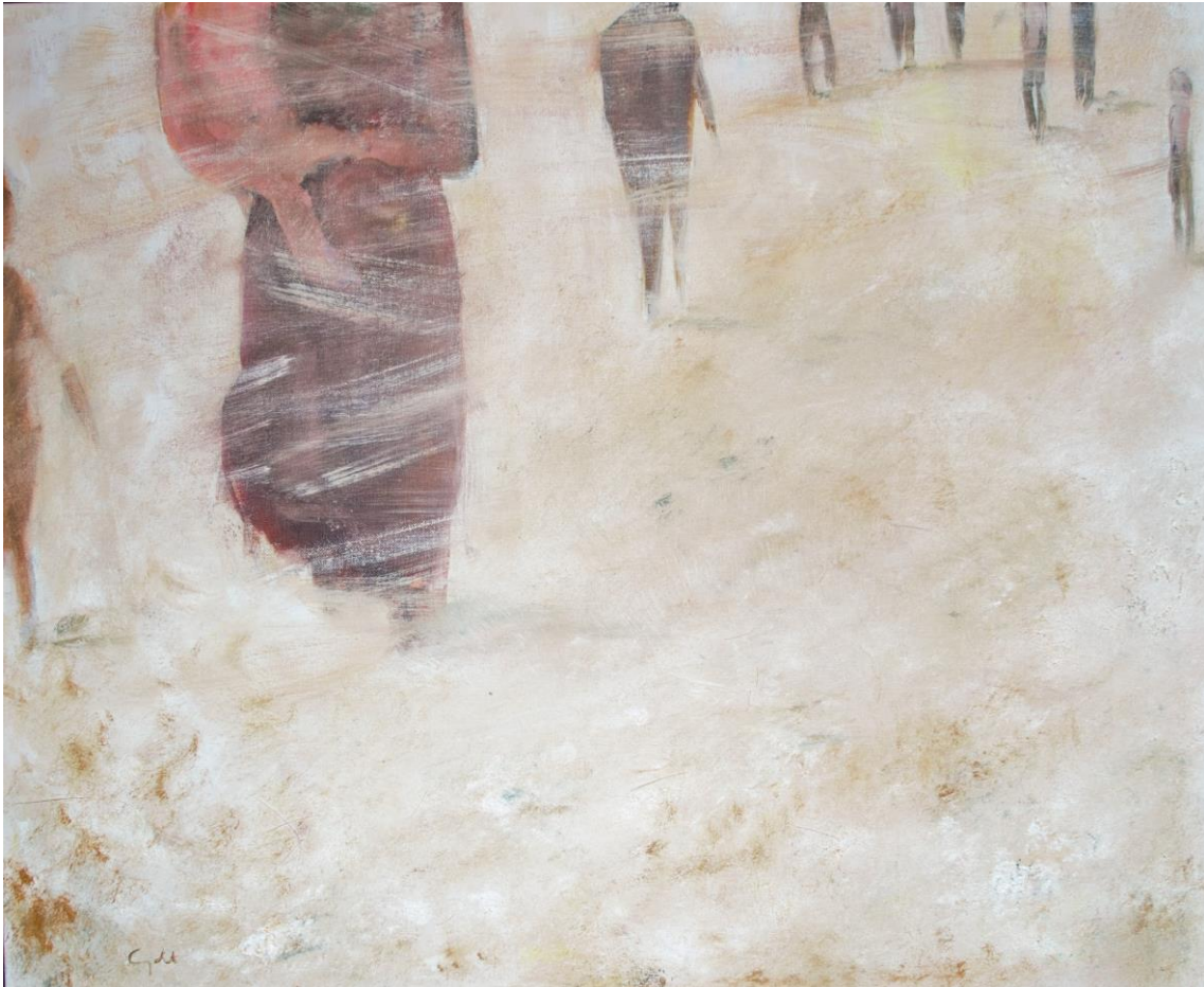
fede capdet de la sèrie com un ocell a la Via Làctia # 8 oli sobre tela 73 x 60 cm.