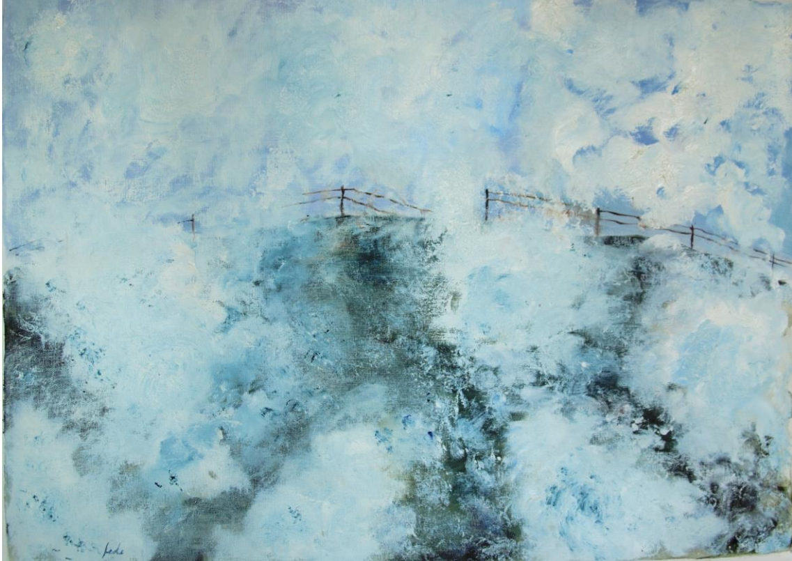
fede capdet de la sèrie com un ocell a la Via Làctia # 2 oli sobre tela 70 x 49 cm.