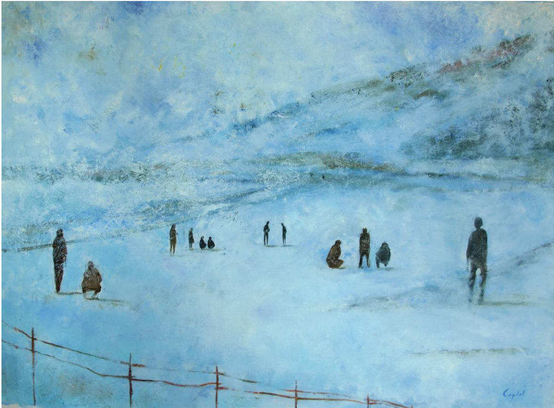
fede capdet de la sèrie com un ocell a la Via Làctia # 4 oli sobre tela 70 x 50 cm.