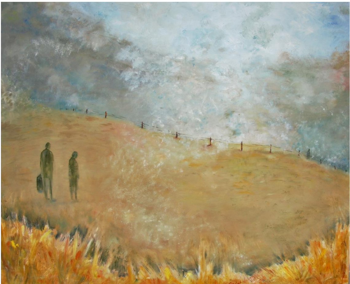
fede capdet de la sèrie com un ocell a la Via Làctia # 6 oli sobre tela 100 x 81 cm.