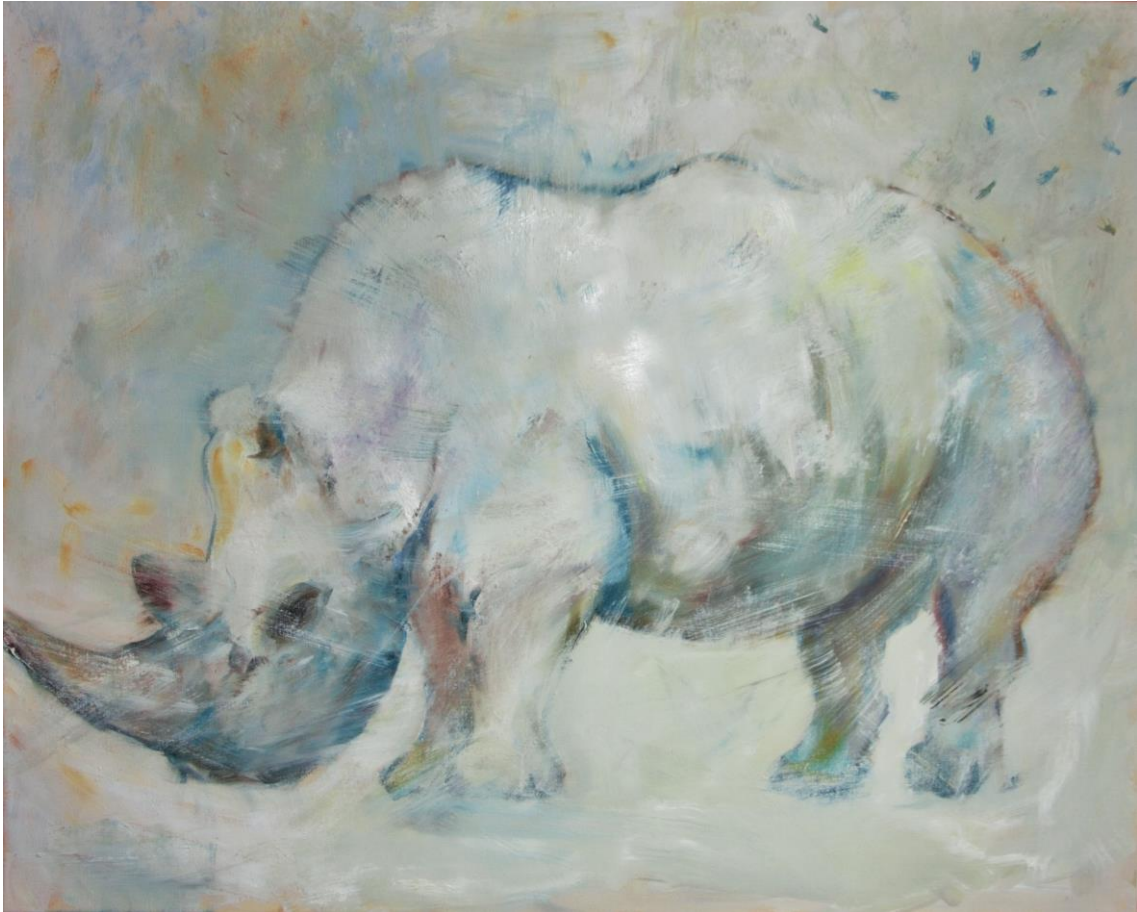
fede capdet de la sèrie com un ocell a la Via Làctia # 7 oli sobre tela 81 x 65 cm.